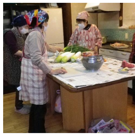
準備をするボランティアのみなさん

飛沫感染防止の為、皆さんにマスクの着用はもちろん、食事でも「黙食」それでも「みんなでおべると美味しいね！」の声、食後はマスクを着けて世間話しを楽しんでもらいました。(笑)